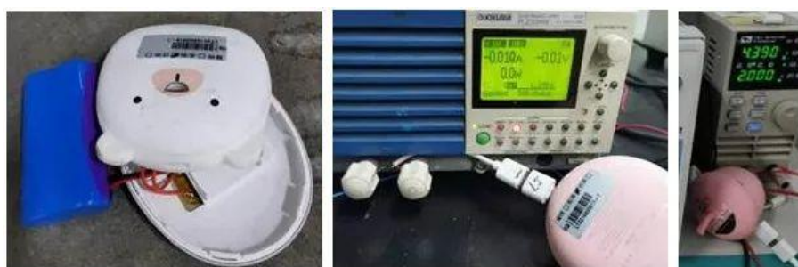
自由跌落試驗後產品狀況

在日常的攜帶或使用中，充電暖手寶難免會發生跌落，在某些特定情況下，比如網購產品快遞運輸過程中暴力分揀、孩子使用產品過程中打鬧嬉戲等，都會使產品更容易發生猛烈撞擊。外殼的作用是保護內部電池和電路板，一旦外殼在撞擊後破裂，電池和線路會裸露在外，極易造成短路、電池受到擠壓等狀況，這都會引發電池的起火爆炸。