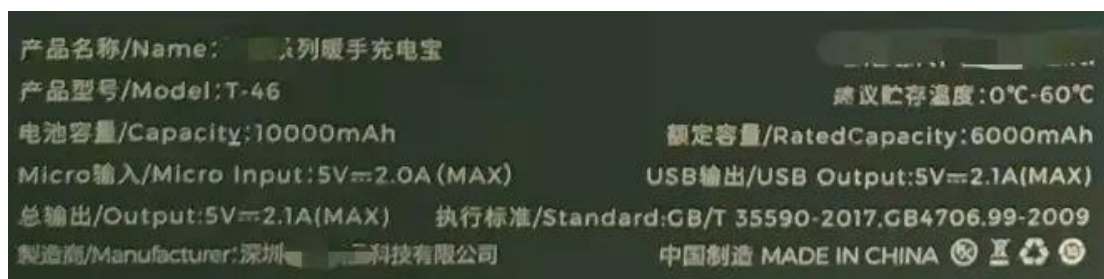
標注額定容量（合格）